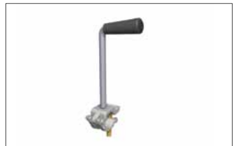
7164002 Håndsving m/kobling 1,6 kg