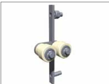
7541005 Styrerulle f/dug 1,1 kg