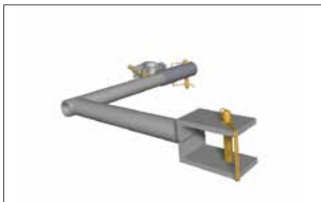
7541009 Konsol t/dugmontering 3,3 kg